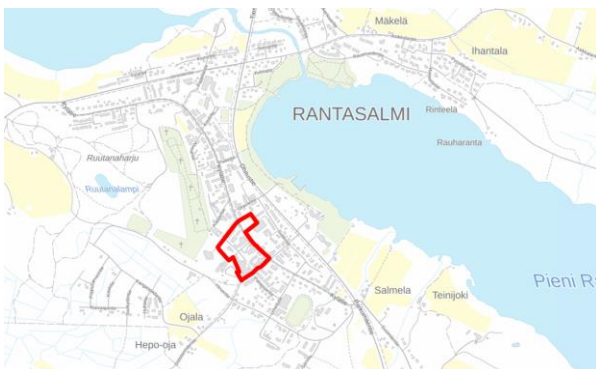
Kuva 1. Kaava-alueen sijainti (MML taustakartalla)

Rantasalmen kirkko sijaitsee suunnittelualueen länsipuolella Kirkkotien päässä. Suunnittelualueen sijainti ja likimääräinen raja-alue on merkitty kansikuvan karttaan ja esitetty alla olevassa kuvassa. Suunnittelualueen pinta-ala on noin 4 ha. Alueella on useita maanomistajia.