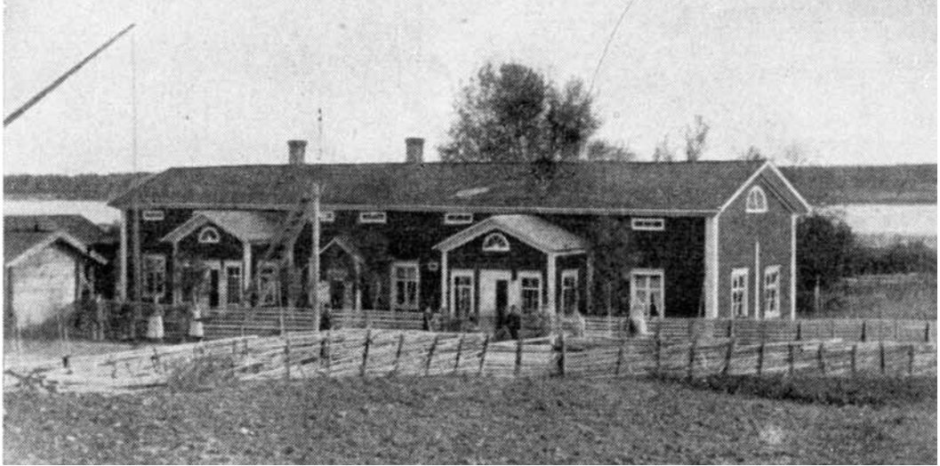
Rantasalmen kirkonkylän ensimmäinen koulurakennus. Pojat ja tytöt sijoitettiin saman katon alle vuonna 1875.