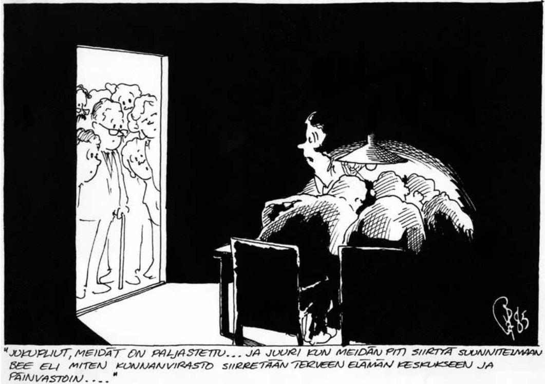
Julkaistu Rantasalmen Lehdessä 23.10. 1985.

rakennuksineen olisi ollut kalliimpi kuin sittemmin toteutettu ala- ja yläasteiden saneeraus ja lisärakennus. Lukion 30-vuotisjuhlat voitiin pitää syksyllä 1992 tilojen suhteen rauhallisin mielin.