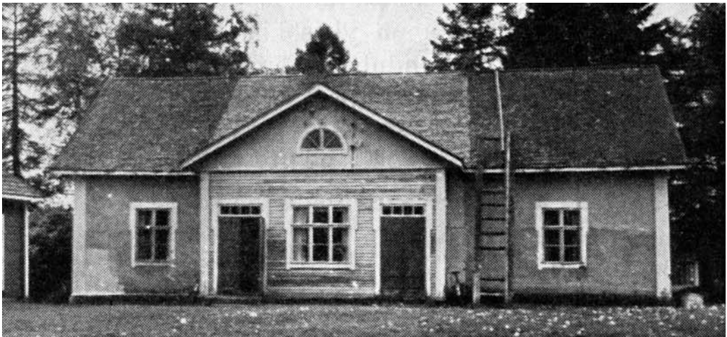
Sallila vuonna 1872. Tässä talossa 25 poikaa aloitti kansakoulunsa.