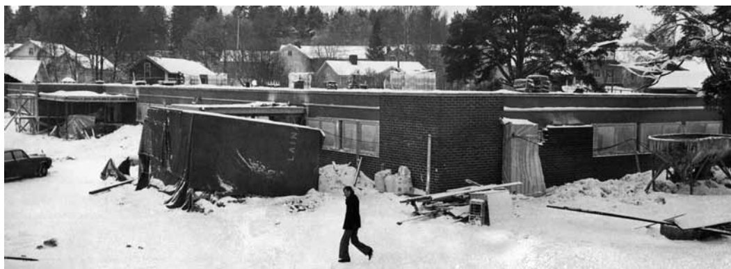
Itä-Savon etusivun kuva vuodelta 1962. Lukio aloitti koulutyön lauantaina 1.9.1962.