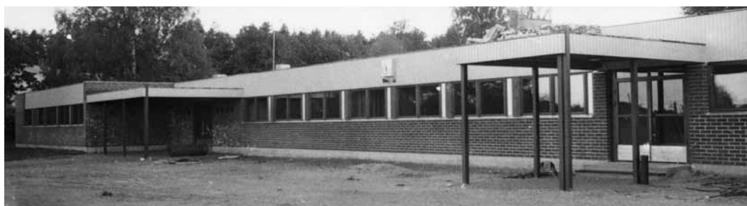
Lukion uudisrakennus harjakorkeudessa.