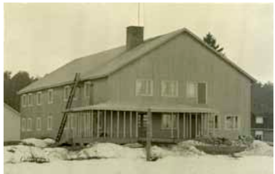
Työväentalo lukion aloittaessa toimintansa.